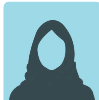
فاطمة حمود براهيم العيدي