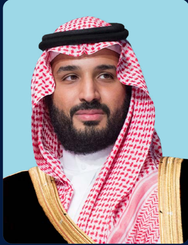
صاحب السمو الملكي ولي العهد رئيس مجلس الوزراء الأمير محمد بن سلمان بن عبدالعزيز آل سعود