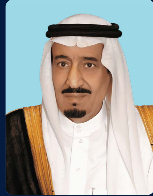
خادم الحرمين الشريفين الملك سلمان بن عبدالعزيز آل سعود