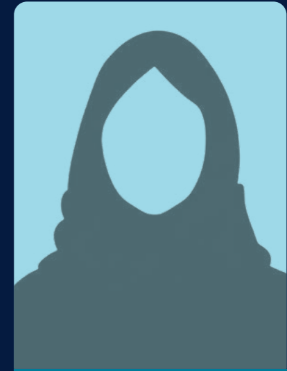
فاطمة حمود براهيم العيدي